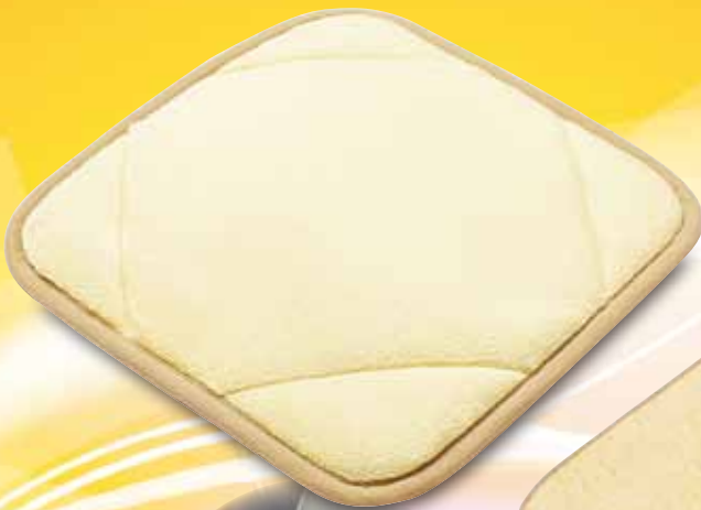
テラヘルツ 座布団